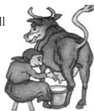
Bilder: Helga Gebert

tete: «Ich bin drei alten Weibern weggelaufen und Häschen Wippschwanz, und soll dir Wolf Dickschwanz nicht entwischen?» und lief kantapper, kantapper in den Wald hinein. Da kam ein Reh herzu-gesprungen und rief: «Dicker, fetter Pfannekuchen, bleib stehn, ich will dich fressen!» Der Pfannekuchen antwortete: «Ich bin drei alten Weibern weggelaufen, Häschen Wippschwanz, Wolf Dickschwanz und soll dir Reh Blitzschwanz nicht entwischen?» und lief kantapper, kantapper in den Wald hinein. Da kam eine Kuh herbeigerannt und rief: «Dicker, fetter Pfannekuchen, bleib stehn, ich will dich fressen!» Der Pfannekuchen antwortete: «Ich bin drei alten Weibern weggelaufen, Häschen Wippschwanz, Wolf Dickschwanz,