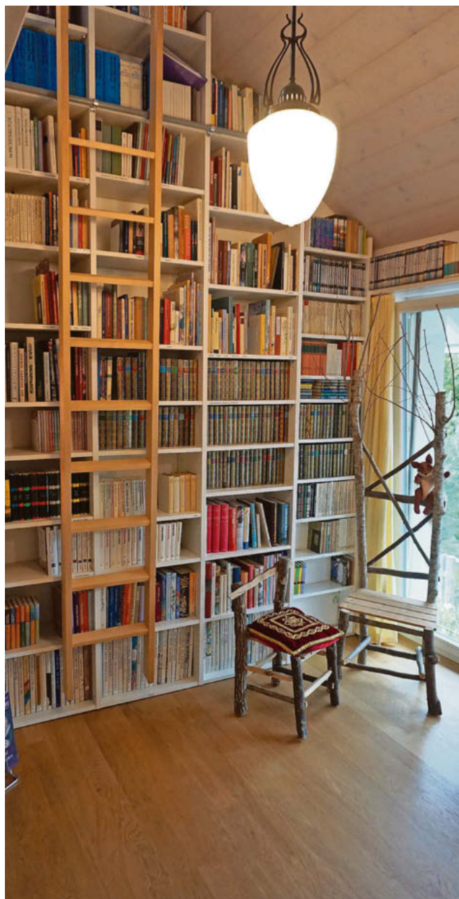
Rund 3000 Märchenbücher aus aller Welt sind hier zu finden.