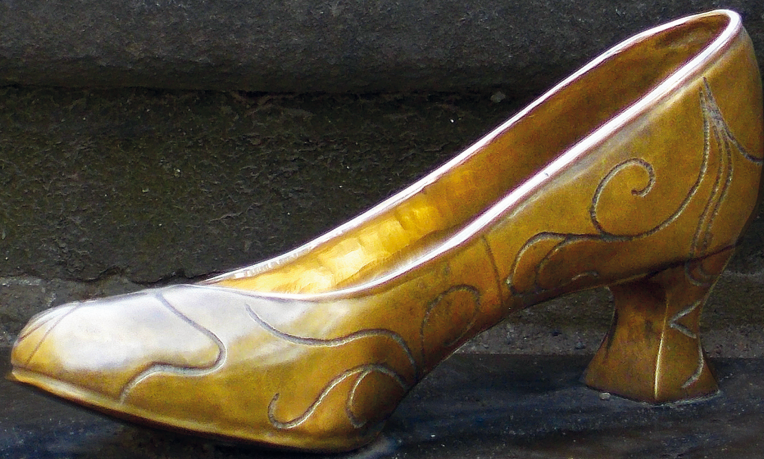
Aschenbrödels Schuh auf der Treppe beim Schloss Moritzburg.

von Schuhen. So tragen die Protagonisten mal Pelzstiefel, mal Bundschuhe aus Birkenrinde oder arabische Babouches. Schuhe waren und sind jedoch nicht für alle erschwinglich und haben allein dadurch einen besonderen Stellenwert in den Erzählungen.